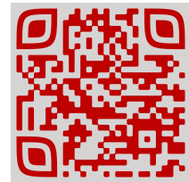
Moon Camp Challenge