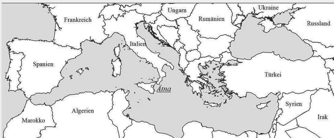
Marker 2: Karte des Mittelmeers mit Position des Untersuchungsgebietes Ätna.

Digitale Bilder bestehen aus Millionen von Bildelementen, den sogenannten Pixeln. Pixel sind die kleinste Flächeneinheit eines digitalen Bildes und können eine beliebige Farbe annehmen. Die digitale Bildverarbeitung befasst sich damit, diese Bilder mit entsprechenden Algorithmen zu verändern.