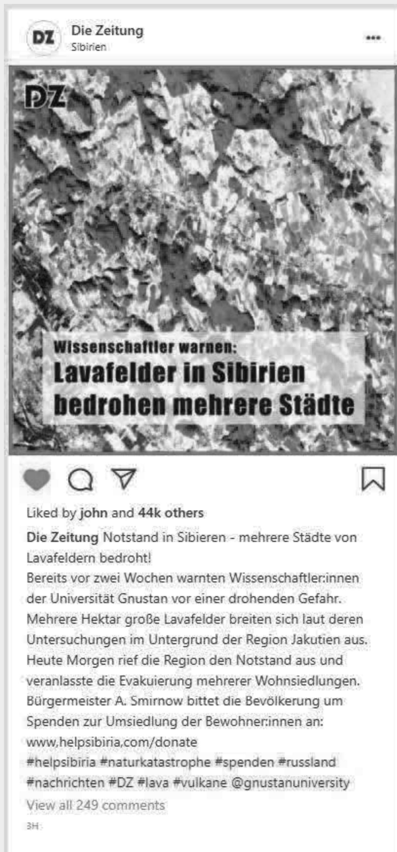
Marker 4: Post von Die Zeitung auf Rossggram Lavafelder in Sibirien bedrohen mehrere Städte.