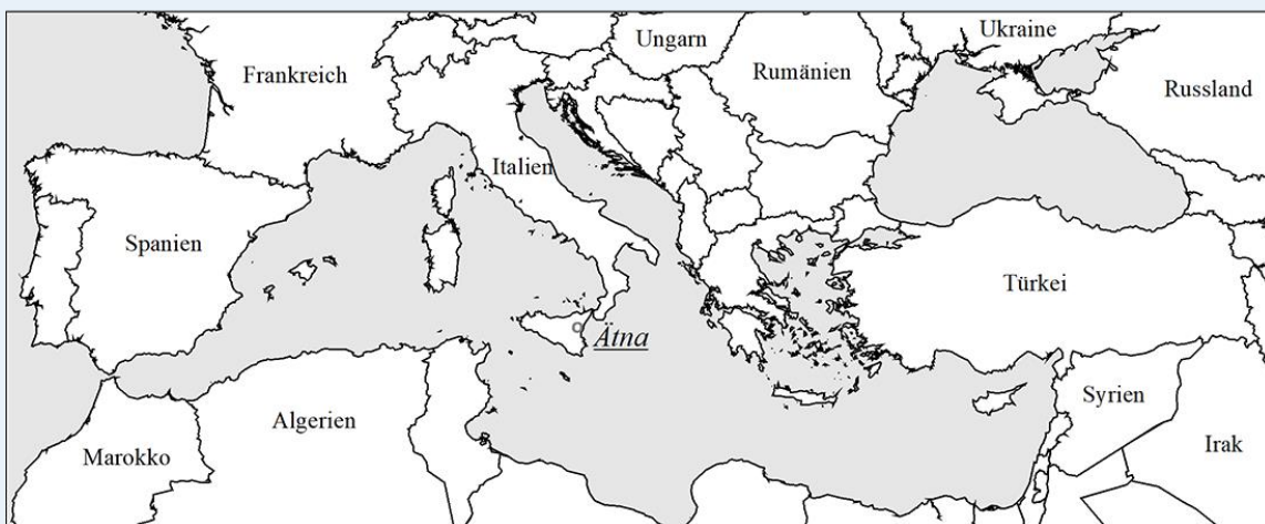
Marker 2: Karte des Mittelmeers mit Position des Untersuchungsgebietes Ätna.

Digitale Bilder bestehen aus Millionen von Bildelementen, den sogenannten Pixeln. Pixel sind die kleinste Flächeneinheit eines digitalen Bildes und können eine beliebige Farbe annehmen. Die digitale Bildverarbeitung befasst sich damit, diese Bilder mit entsprechenden Algorithmen zu verändern.